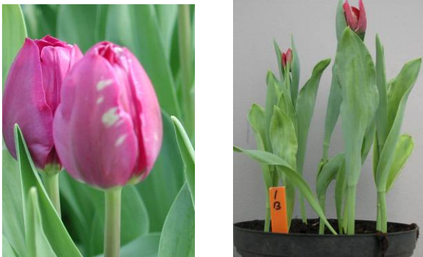
Figuur 2 en 3. Bloem- en bladafwijkingen in de kas, veroorzaakt door galmijten tijdens de bewaring van de bollen

De bestrijding van galmijten in de praktijk is met Actellic niet altijd meer afdoende. Het wegvallen van Actellic zonder alternatief voor een bestrijding van gal- en bollenmijten kan tot grote economische schade leiden bij zowel de teelt-, handel- als broeierijbedrijven. Zonder bestrijdingsmaatregelen leiden galmijt en bollenmijt tot een aanzienlijke schade aan plantgoed, onverkoopbare bollen en bloemen (figuur 2 en 3).