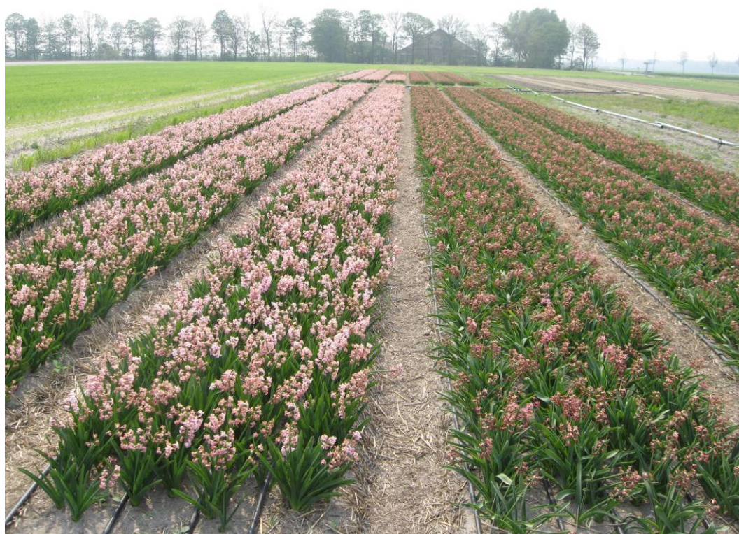
Foto. Overzicht proefveld (28-4-2011)