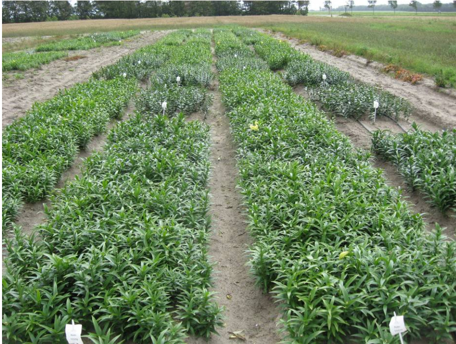
Foto. Overzicht Bollenmeer 9-8-2011